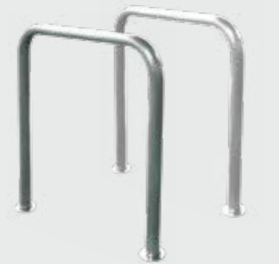
APARCABICILETAS U UVAP4 / UVAP4I 955 x 790