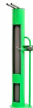
ESTACIÓN DE SERVICIO BIKI UVAP13